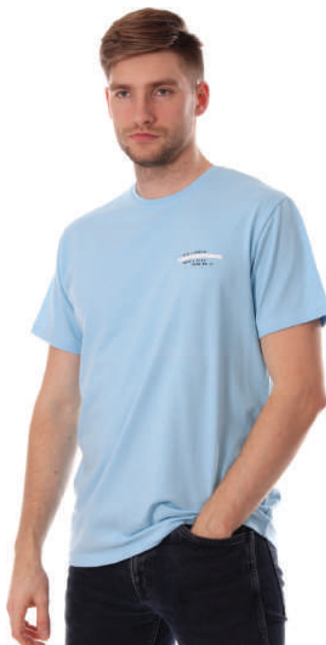
TS 10013/7 S-4XL, 100% bawełna