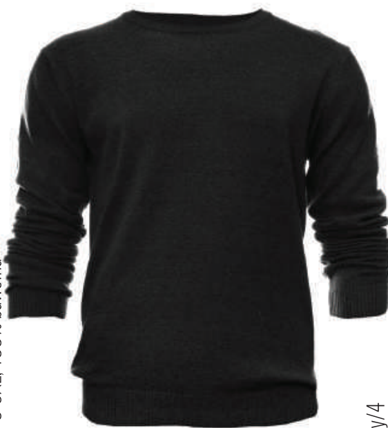
SW 6218/2 S-3XL, 100% bawełna