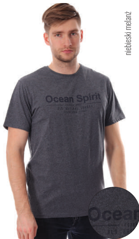
TS 10007/7 S-3XL, 80% bawełna 20% poliester