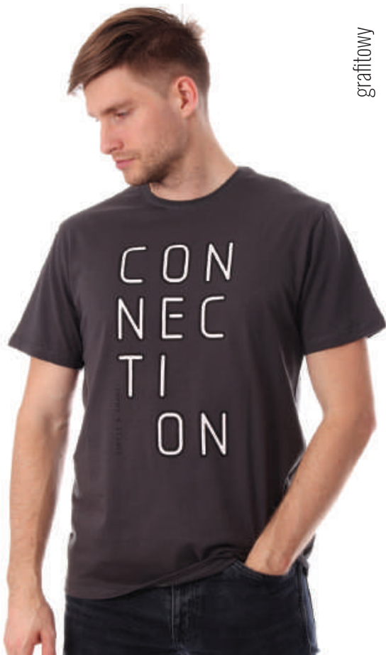
TS 10000/4 S-3XL, 100% bawełna