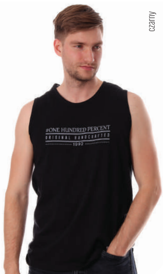
BK 10019/2 M-4XL, 100% bawełna