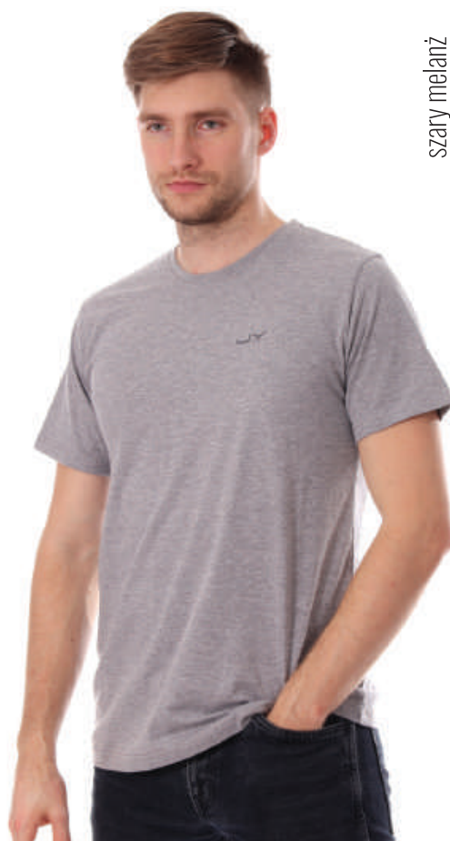
TS 1339/6 S-4XL, 100 % bawełna