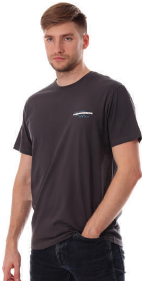
TS 10013/4 S-4XL, 100% bawełna