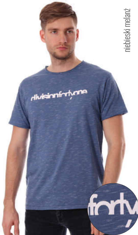
TS 10009/7 S-3XL, 80% bawełna 20% poliester