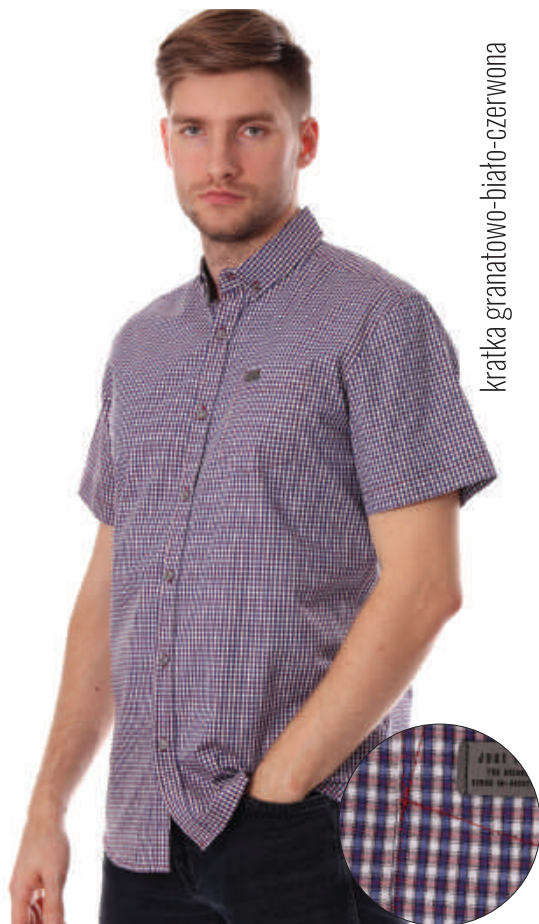
KS 10028/3 M-4XL, 97% bawełna 3% elastan