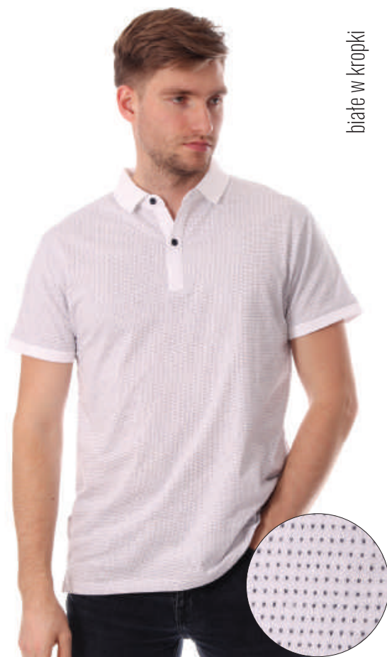
białe w kropki