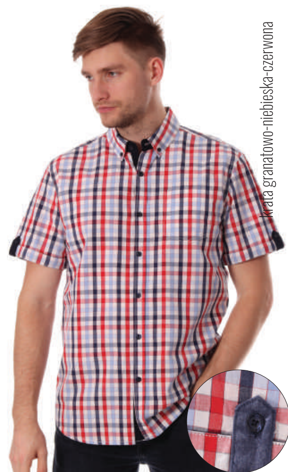
KS 10037/13 M-4XL, 100% bawełna