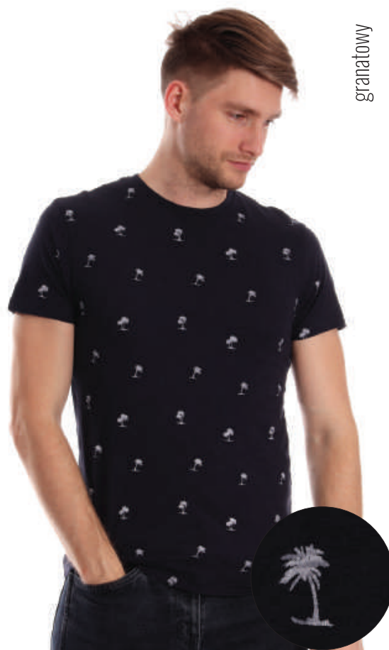
TS 10042/3 S-2XL, 100% bawełna