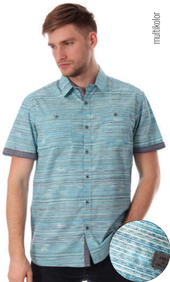
KS 10026/13 M-3XL, 100% bawełna