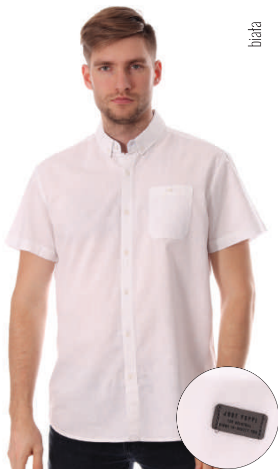
KS 10034/1 S-3XL, 70% bawełna 30% len