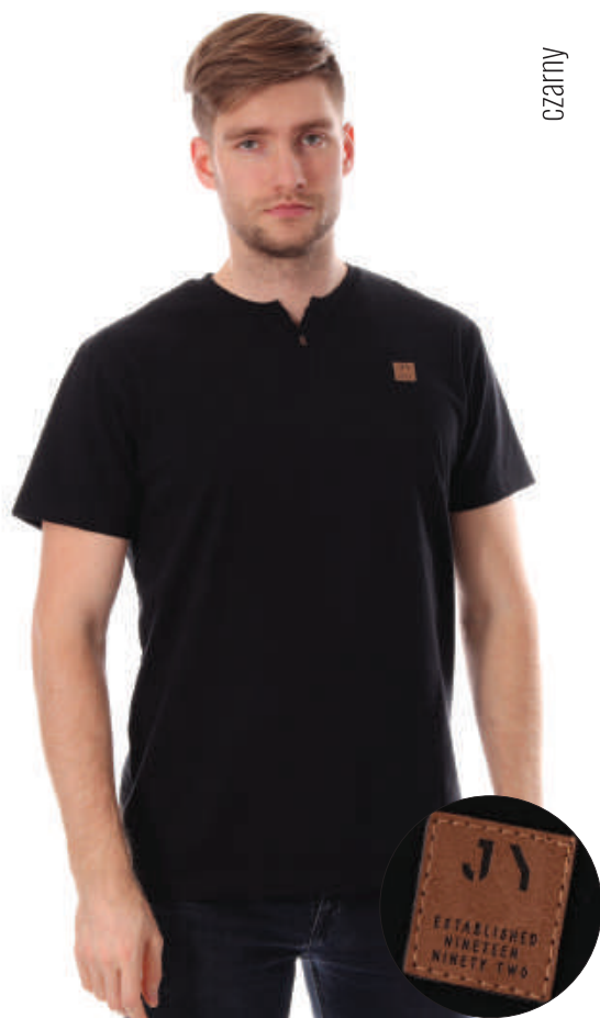
TS 10018/2 S-2XL, 100% bawełna