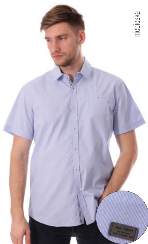
KS 10035/7 M-4XL, 100% bawełna