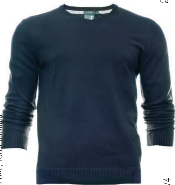
SW 6217/3 S-3XL, 100% bawełna