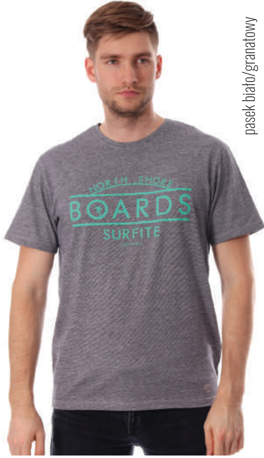
TS 10003/3 S-3XL, 100% bawełna