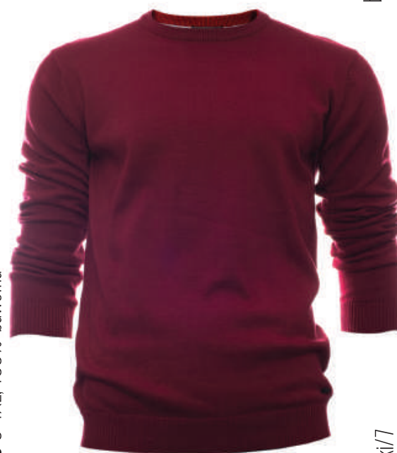
SW 9622/5 S-4XL, 100% bawełna