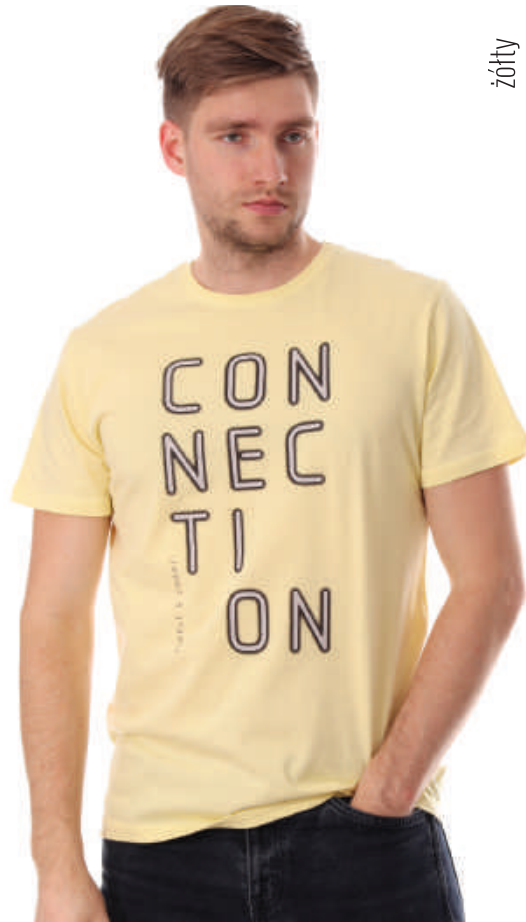
TS 10000/9 S-3XL, 100% bawełna