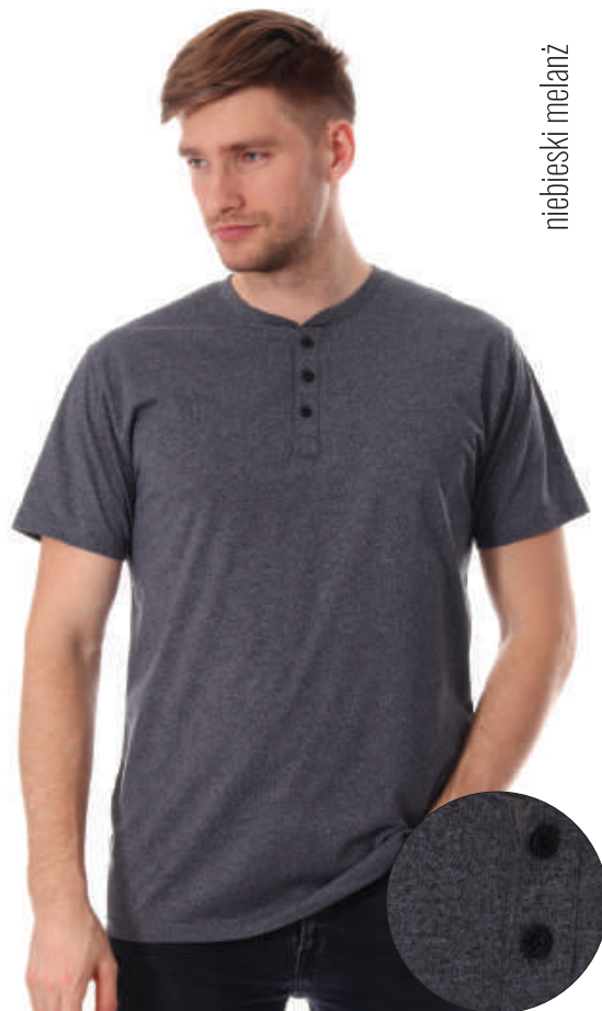
TS 10014/7 M-4XL, 80% bawełna 20% poliester