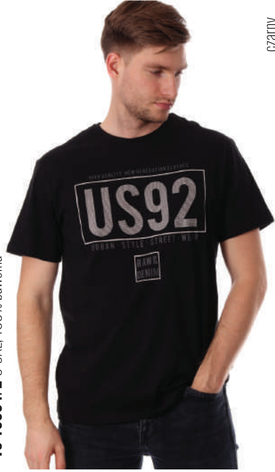
TS 10004/2 S-3XL, 100% bawełna