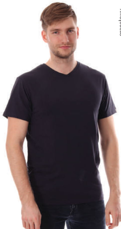
TS 6232/3 S-2XL, 95% bawełna 5% elastan