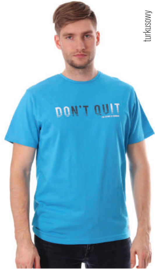
TS 10005/7 S-4XL, 100% bawełna