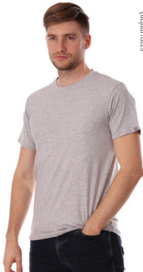
TS 6231/6 M-2XL, 95% bawełna 5% elastan