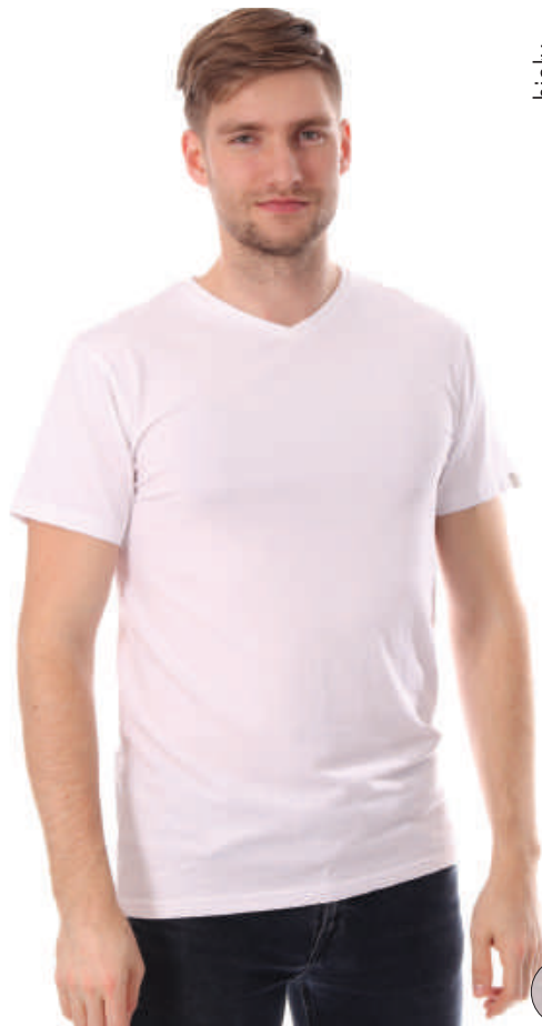
TS 6232/1 S-3XL, 95% bawełna 5% elastan