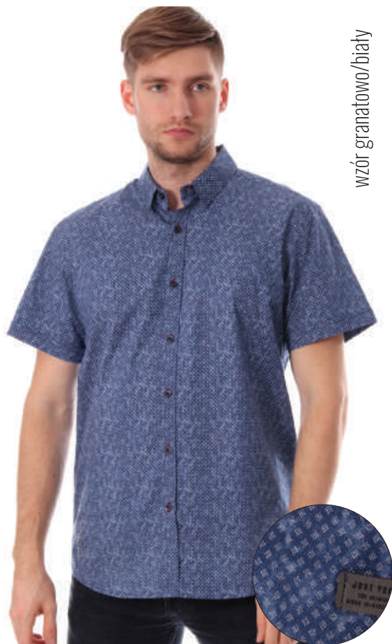
KS 10036/3 S-3XL, 97% bawełna 3% elastan