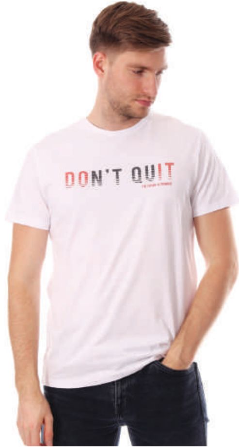
TS 10005/1 S-4XL, 100% bawełna