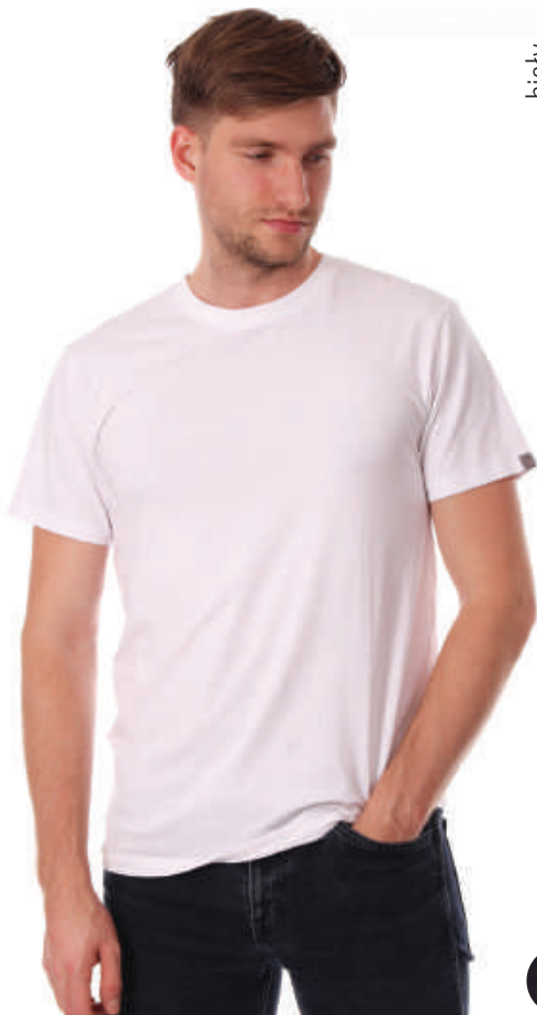
TS 6231/1 S-3XL, 95% bawełna 5% elastan