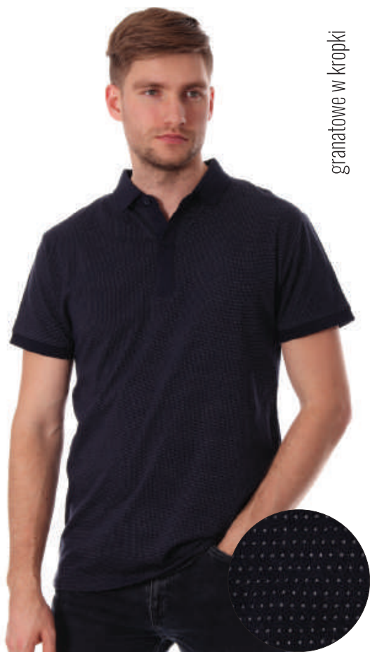
granatowe w kropki