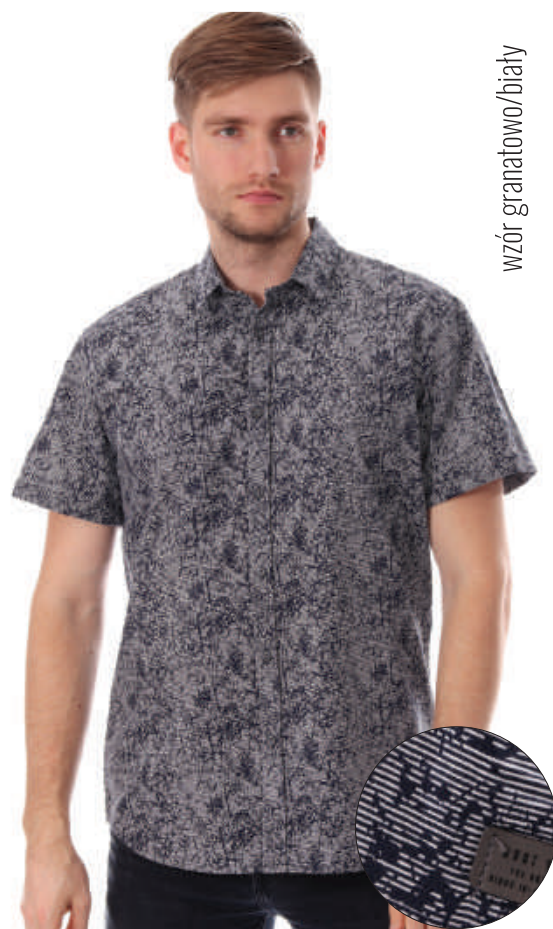
KS 10027/3 S-2XL, 100% bawełna