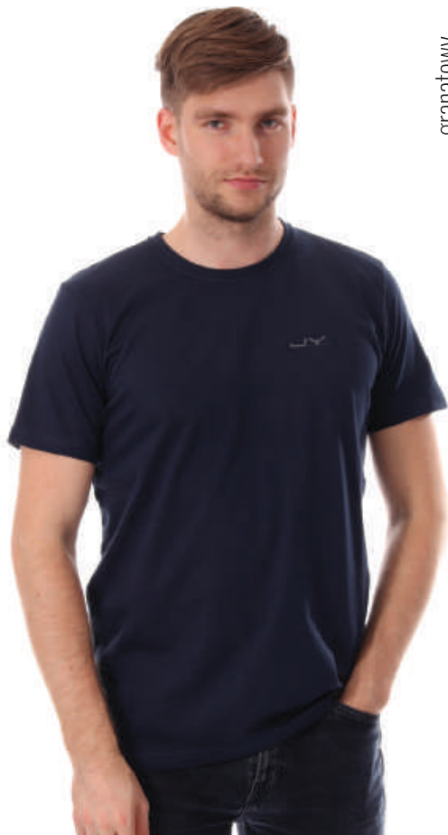
TS 1339/3 S-4XL, 100 % bawełna