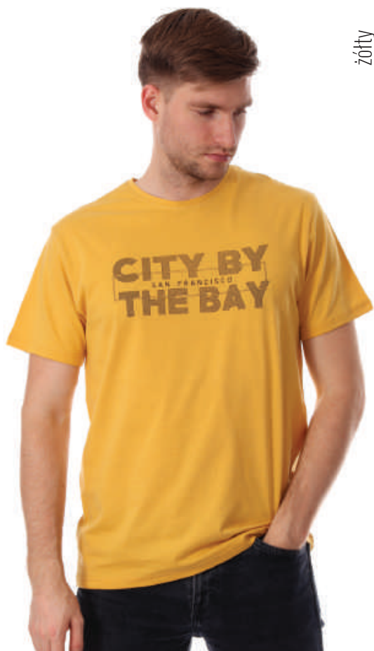
TS 10012/9 S-2XL, 100% bawełna