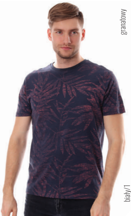
TS 10043/3 S-2XL, 100% bawełna