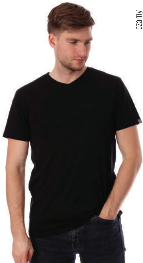
TS 6232/2 M-3XL, 95% bawełna 5% elastan