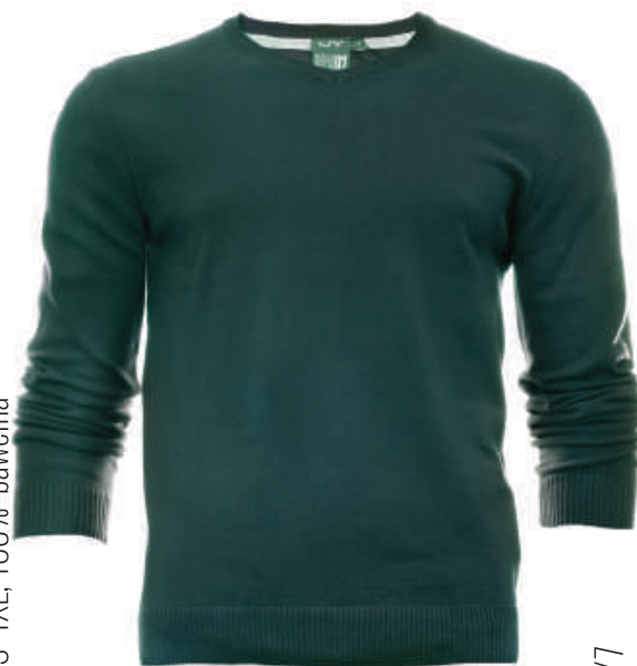
SW 9621/8 S-4XL, 100% bawełna