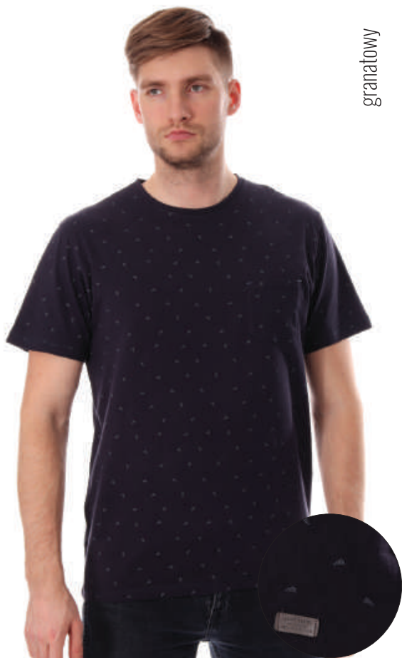
TS 10006/3 M-4XL, 100% bawełna