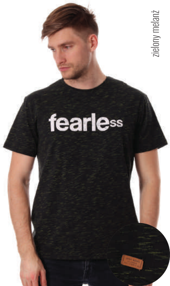
TS 10008/8 S-2XL, 80% bawełna 20% poliester