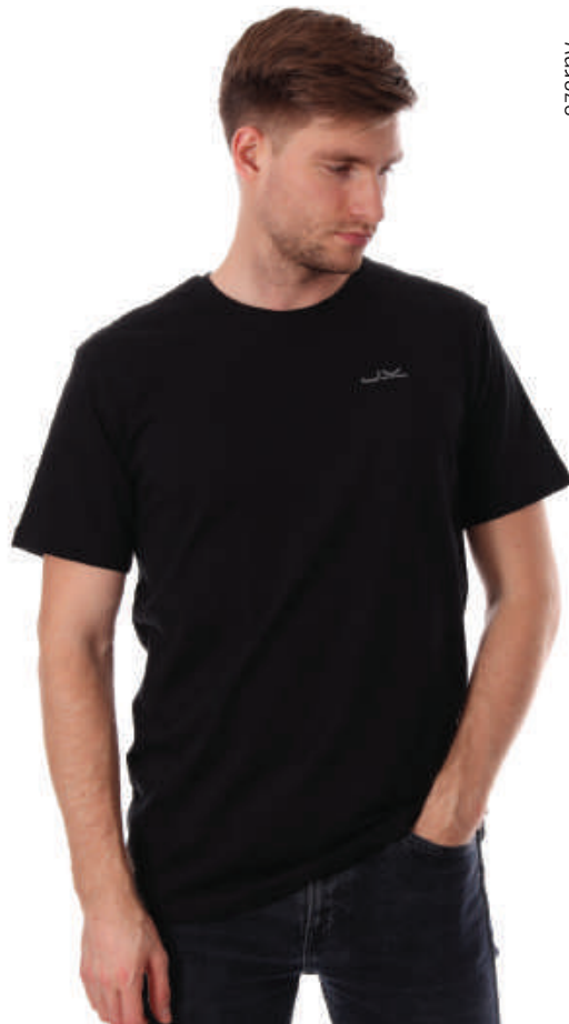
TS 1339/2 S-4XL, 100 % bawełna