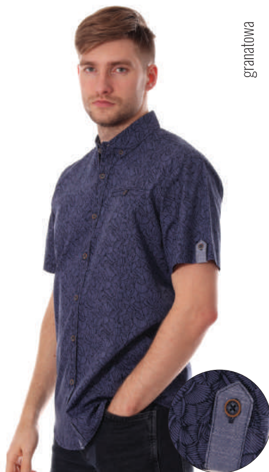
KS 10029/3 M-4XL, 100% bawełna